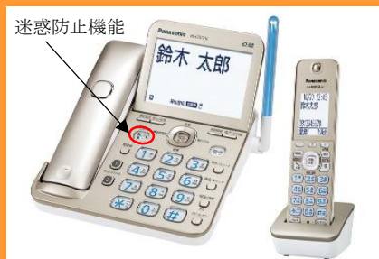
対象機器の一例（パナソニック）