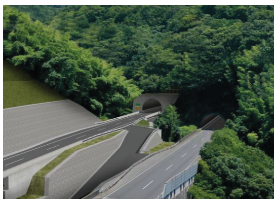
広島呉道路 完成イメージ (呉トンネル起点側)