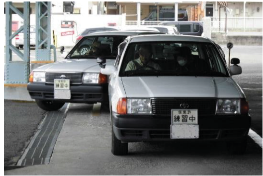
高齢者運転ドック (自動車学校内のコースを使った実地研修)

呉市交通安全推進協議会連合会の主催により、呉自動車学校で呉市交通安全研修会を開催しています。