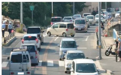
国道 31 号大屋橋北詰交差点付近の渋滞状況