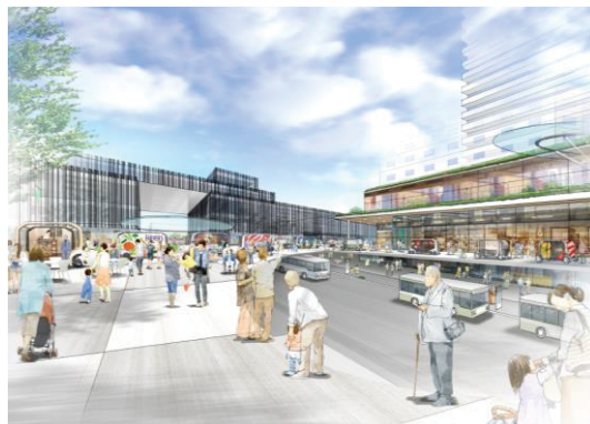
2階デッキの国道側から駅ビルを見た景色 (デッキの下を透かしたもの)