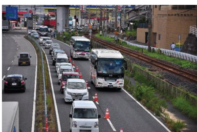
バス等専用レーンの設置 (国道 31 号専用レーンを走行する JR 呉線代行バス)