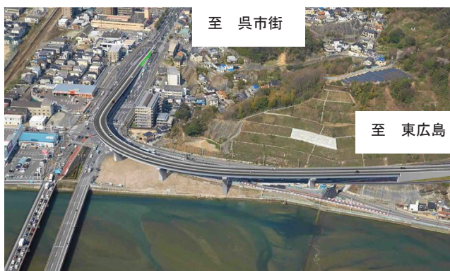
東広島・呉自動車道 阿賀 IC 完成イメージ