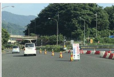
バス等専用レーンの設置 (広島呉道路坂北料金所～坂北 IC に設置)