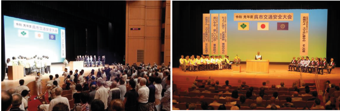
令和元年度 呉市交通安全大会の様子

交通安全思想の普及のため、例年7月ごろ、呉市交通安全大会を開催しています。本大会では、長年にわたり交通安全推進委員として活動していただいた方々や交通安全活動の推進に貢献いただいた団体への表彰、また、市と呉市交通安全推進協議会連合会の主催で募集した交通安全標語の中から入選した作品の表彰等を行っています。