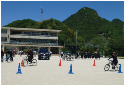
自転車の安全な利用（中学生）