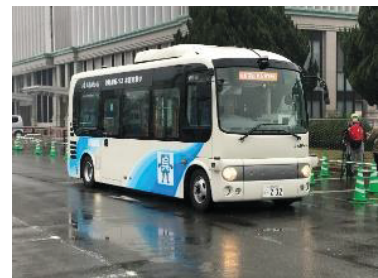
R2年度 自動運転バス 走行実験の様子