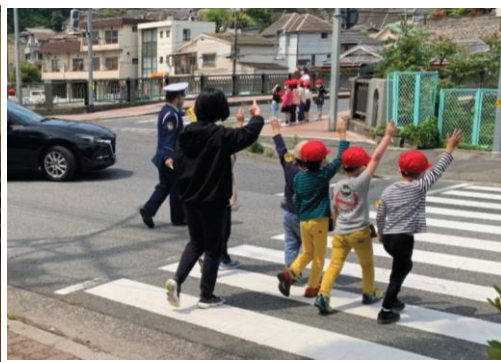
横断歩道を渡る実習