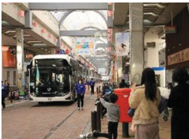
R元年度 水素バス 走行実験の様子

これまで呉市では、令和元(2019)年度に水素バス、令和2(2020)年度に自動運転バスなどの実証実験に継続して取り組んでいます。また、令和3(2021)年度以降は、自動運転を支援する走行環境整備に係る検討に着手しています。