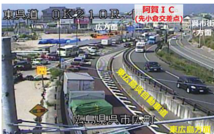
東広島・呉自動車道阿賀 IC (先小倉交差点) の渋滞状況