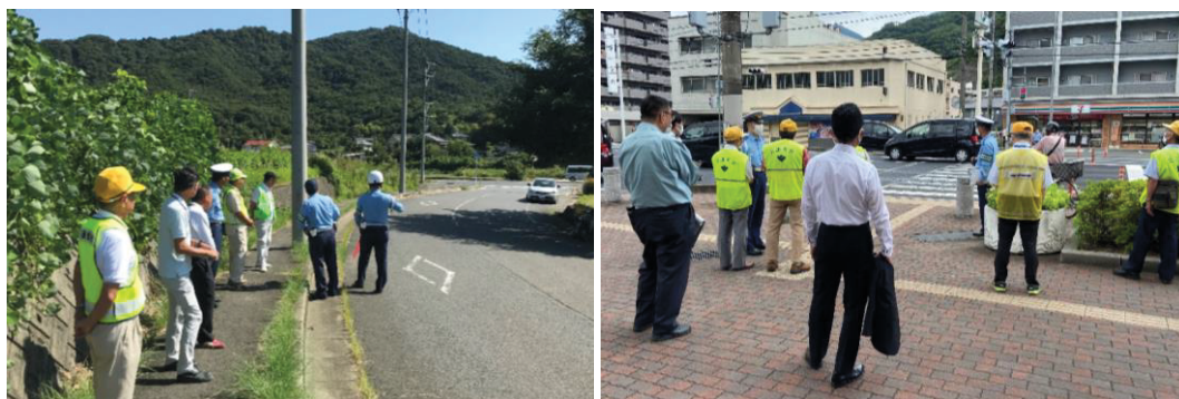
交通死亡事故再発防止現場検討会の様子

市内で死亡事故が発生した場合、警察、市の交通安全担当者及び地区の交通安全推進委員等による交通死亡事故再発防止現場検討会を行い、必要な改善策等を実施しています。