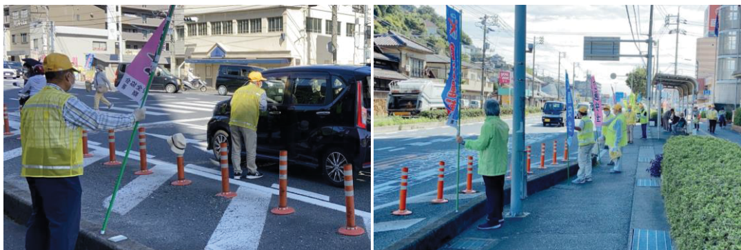
各地区の街頭キャンペーンの様子