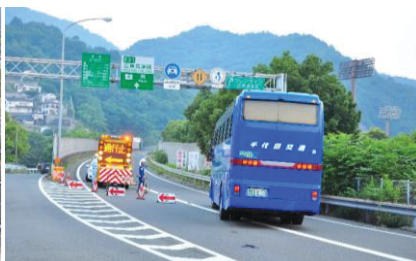
災害時 BRT※の運行 (呉 IC から広島呉道路に進入するバス)

バス位置情報提供システム (バス車内に簡易 GPS システムを搭載、サーバーに位置情報を送信し、インターネットの地図上に位置情報を表示する)