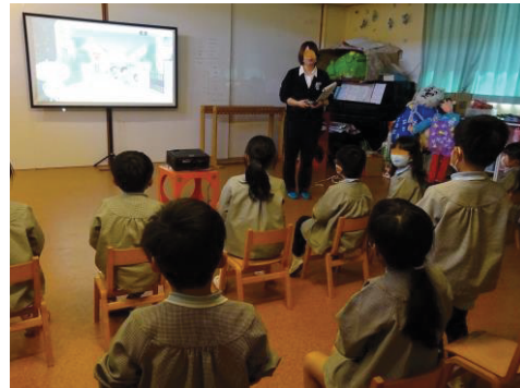
交通ルールの確認

警察，交通安全協会，市の交通安全担当者及び各地区の交通安全推進委員等と協力して，就学前の年長児や新入学児童に対して，通学路等における交通ルールの確認や横断歩道の渡り方などを学ぶ交通安全教室を行っています。