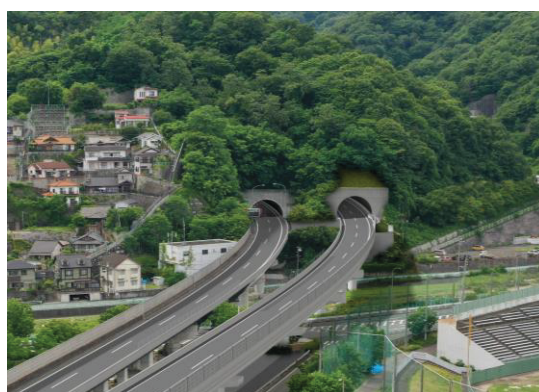
広島呉道路 完成イメージ (呉トンネル終点側)

これらの事業により、交通渋滞の緩和及びそれによる交通安全の確保、災害時の交通機能の強靱化、都市間の連携等による経済活動の活性化などの効果が期待されています。