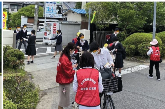
交通安全思想の更なる普及（高校生）