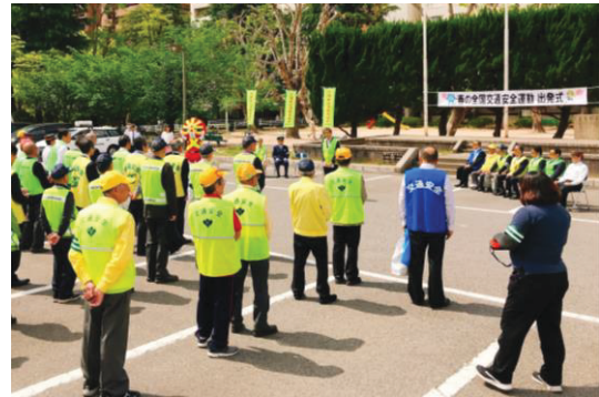
令和元年度 春の全国交通安全運動 出発式の様子