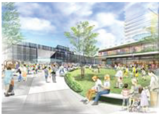
2階デッキの国道側から駅ビルを見た景色

バス・タクシーが走行する空間（1階交通ターミナル）と、低速・多機能・小型の次世代モビリティと歩行者が共存する賑わい空間（2階デッキ）とを分離することで、歩行者の安全確保と、利便性や回遊性の向上を図ることを目指しています。