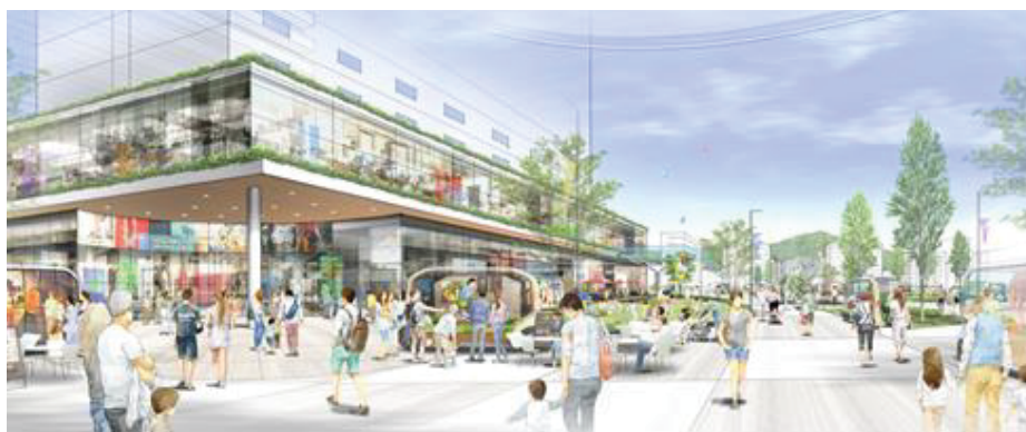
駅ビルから出て2階デッキの上から灰ヶ峰を見た景色