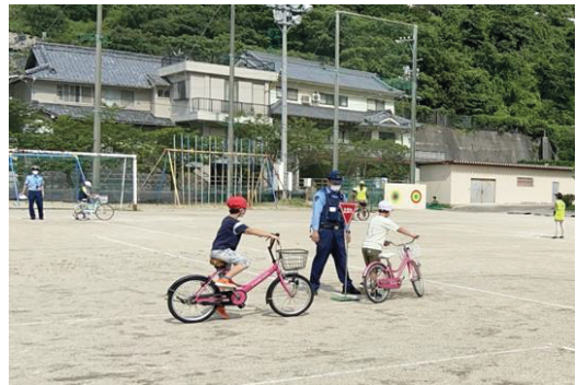
自転車の安全な利用（小学校中学年）

警察、交通安全協会、市の交通安全担当者及び各地区の交通安全推進委員等と協力して、成長過程に合わせて段階的に交通安全教育を実施しています。