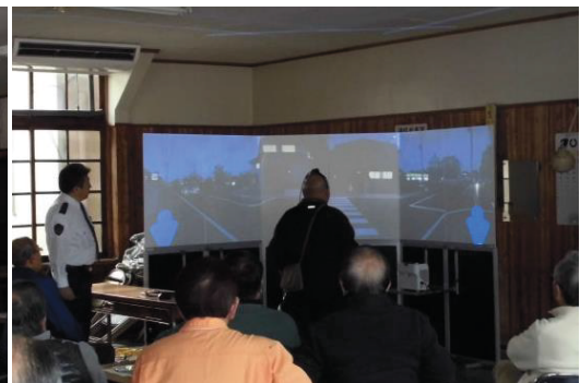
歩行環境シュミレータを使った体験研修