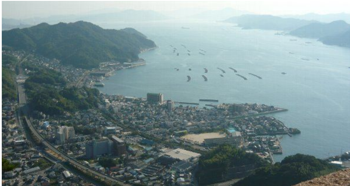
天狗城山からは、天応の町と悠然と広がる瀬戸内海を一望できます！