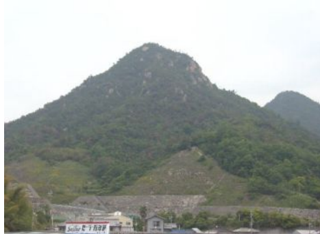
天狗城山遠景。天応の町を見守ってきました。

クレアライン天応料金所付近の登山口に、案内看板と、「天狗城山入口」という看板があります。