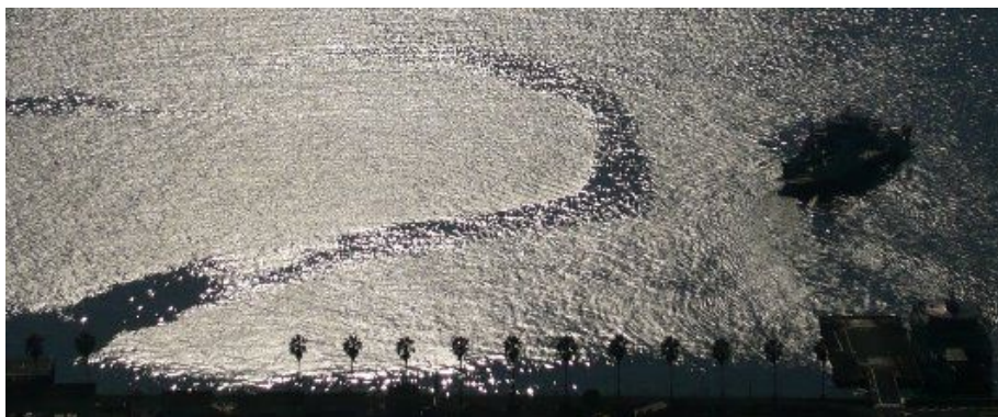
海は輝いていました！ぜひ、この絶景を皆さんも楽しんで下さい。