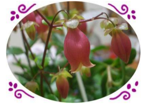
エンゼルランプの花言葉 「あなたを守りたい」

子どもの前で家族に対して暴力をふるうことを「面前DV」といい、直接、子どもに対する暴力はなくても、子どもへの心理的虐待にあたります。また、家族に対する暴力を見た子どもが「思い通りにならない時は暴力をふるっていい」と誤った考え方を身につけてしまうと、家族や友だちに対して暴力的になってしまうこともあります。