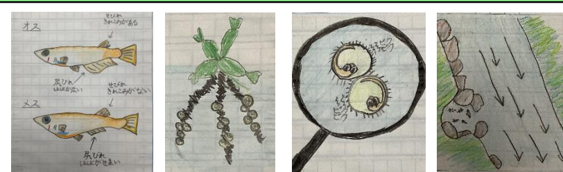
この他にも、メダカについて様々な観察をしている