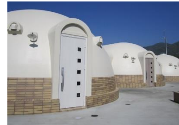
ドーム型コテージ