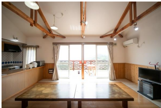
木造コテージ室内