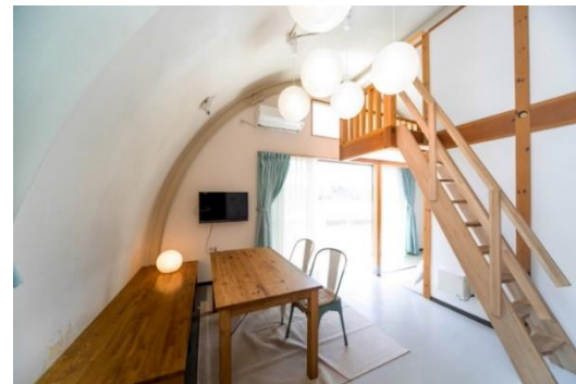
ドーム型コテージ室内