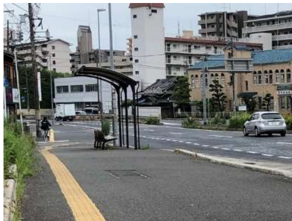
<歩道及びバス停のバリアフリー化（国道185号）>