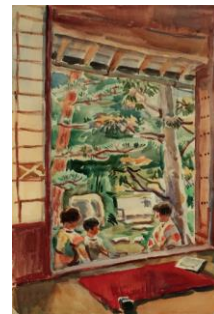
4 《庭先の孫娘たち》1946年頃