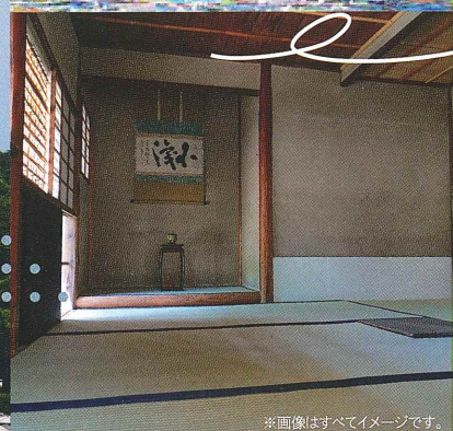
※画像はすべてイメージです。