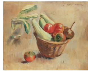
2 《小さな籠の野菜》制作年不詳