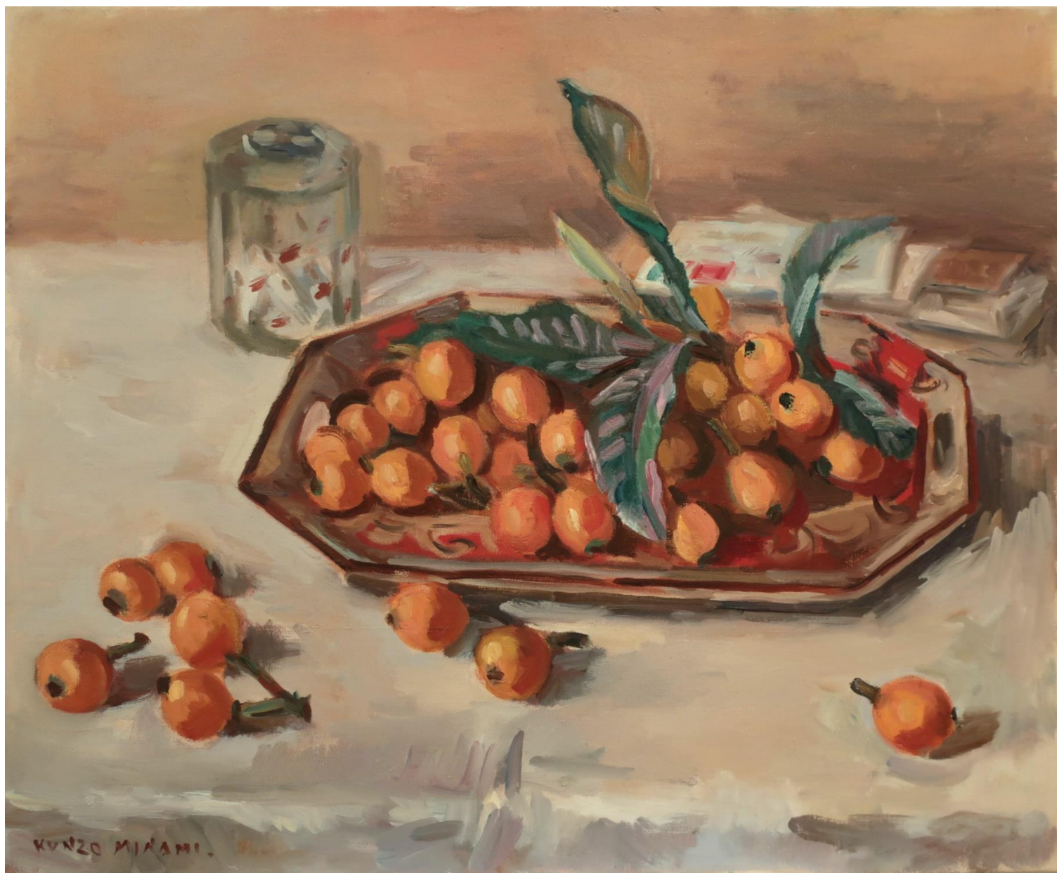
南薫造《卓上の枇杷》1948年頃