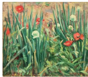
1 《雛げしと窓坊主》1946年頃

また本展では、平成30年の西日本豪雨災害で被災し、現代の修復技術で見事によみがえった作品も紹介します。南が暮らした母屋や多くの名作が生み出されたアトリエなどもあわせてご鑑賞ください。