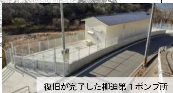
復旧が完了した柳迫第1ポンプ所