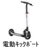
電動キックボード