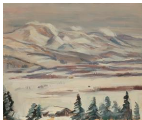
1 《雪景色》 1923年頃

南薫造記念館では、呉市安浦町出身の洋画家・南薫造(1883-1950)の没後70年を記念した特別展を三部構成で開催しております。第Ⅱ期のテーマは「愛しき人・親しき風景」です。自分の家族や親しい人々を描いた人物画からは、南の温かな愛情が伝わってきます。また旅先などで心を打たれ絵筆を走らせた風景画からは、南の心の高ぶりが、明るく鮮やかな色彩となって目に飛び込んできます。本展では、南が愛した人々や、親しんだ風景を中心に、親しみやすいモチーフと柔らかな筆致で見る者の心を癒やす南薫造の作品を紹介します。また、南が暮らした母屋や多くの名作が生み出されたアトリエには、南の遺品を多数展示しております。ぜひ、あわせてご鑑賞ください。