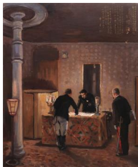
3 《広島大本営軍務親裁図下絵》 1927年