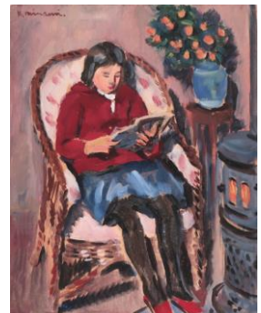
4 《読書》 1923年