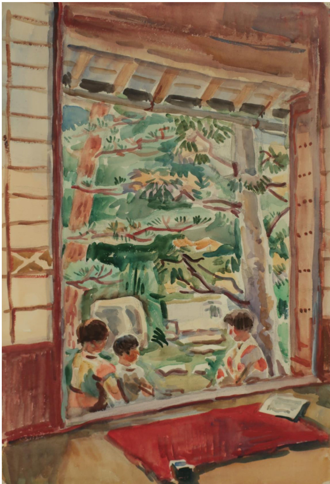
南薫造《庭先の孫娘たち》1946年頃