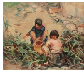
2 《裏庭の孫娘》 1946年頃