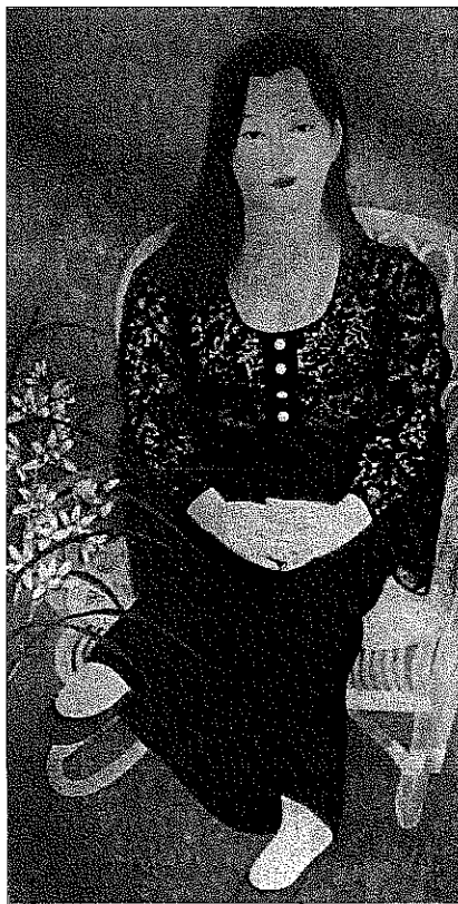
益井三重子《レースのひと》1973（昭和48）年、150.0×75.0 cm、紙本彩色