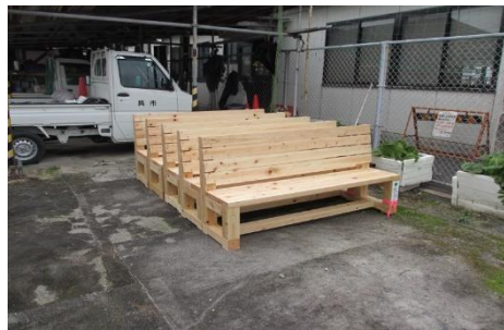
(7) 灰ヶ峰展望台 ベンチ 2 基