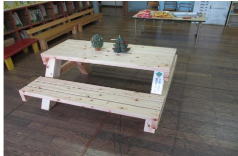
(6) マリンパーク川原石 ベンチ 5 基