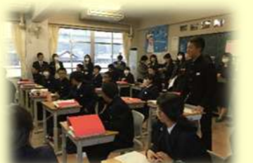
呉市「学びの革新」 推進研修会