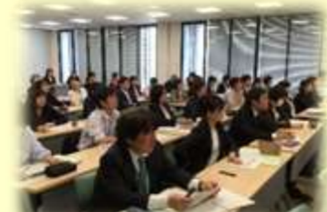
小中一貫教育推進 コーディネーター研修会