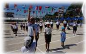
児童生徒合同行事