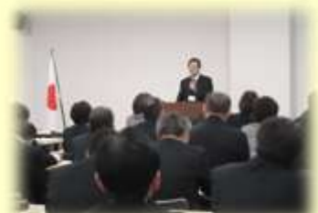
小・中・高合同 校長会・教頭会