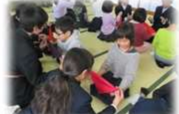
児童生徒合同授業