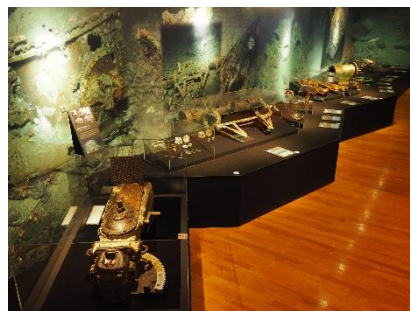
▲企画展示室内 (初公開の戦艦大和引揚げ品)