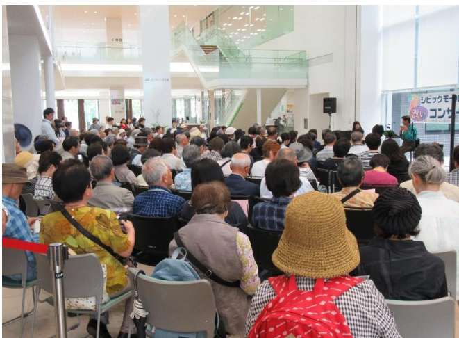
前回(第34回)演奏の様子