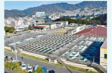
▲宮原浄水場(市営・県営)(青山町)