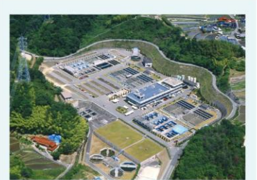
▲瀬野川浄水場(広島市安芸区畑賀町)