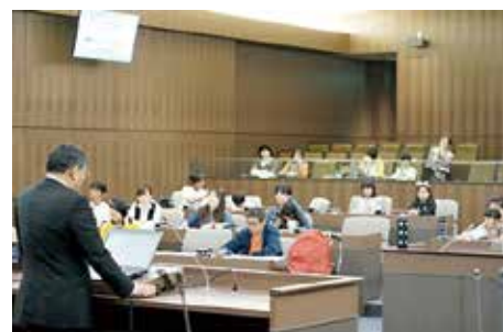
議会のしくみを説明