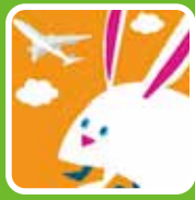
▲このアイコンが目印

呉市議会ホームページ https://www.city.kure.lg.jp/site/gikai/