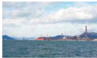
呉湾からの工場群

市長は、農業や漁業と体験型観光、重工業とクルーズ観光など、呉が誇る産業をときめきあふれる姿に発展させ、呉から日本を変える新しいモデルをつくり出すと言っています。が、産業振興が言われ始めかなりの時間がたっている中、なかなか実を結んでいない現実があります。