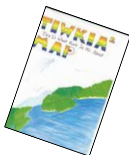
↑発表用のガイドブック