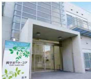
呉サポート・コア