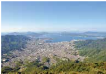
中小企業の支援が課題

創業する以上に廃業する企業が多いのが本市の現状です。中小企業の自助努力や創意工夫を市全体で支援するため、条例を制定したいと考えており、議会や中小企業関係団体などの意見も聞きながら検討していきます。