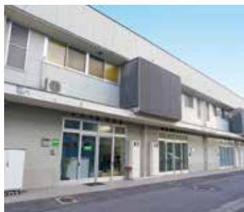
呉ジャンプ・コア

創業を目指す人等に負担の少ない入居費用で賃貸スペースを提供するとともに、インキュベーション・マネージャー等の専門スタッフが経営・技術的課題を解決するための適切なアドバイス等を行うことにより、独立を支援する施設。