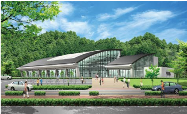
市営プールのイメージ図