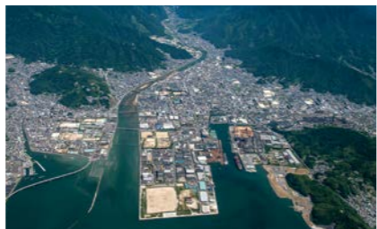
阿賀・広地区上空

くれワン ダークランド構 想推進会議な どが立ち上が り、構想の実 現に向けて具 体的な取り組 みが進められ ています。こ の構想には 人口4万6千人を擁する広地区 を含む東部地区のまちづくり については余り触れられていま せん。どのように考えていますか。