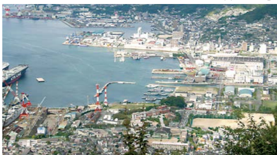
呉湾(海上自衛隊上空)を望む

私は折りに触れてオンリーワンのまちづくりと言いつつ、呉をオンリーワンの海上自衛隊のまちにしなければならぬと考えています。