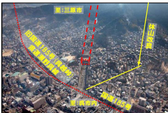
【写真①】 呉市街上空より休山トンネル西側坑口を望む