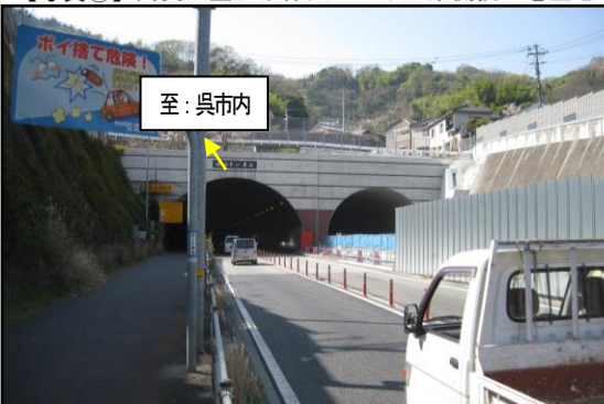
【写真④】 東側坑口付近近景