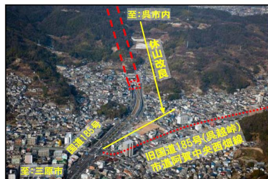
【写真③】 阿賀上空より休山トンネル東側坑口を望む