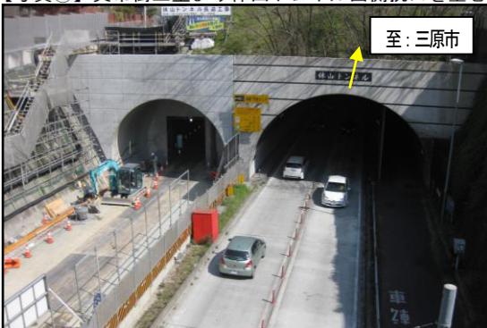
【写真②】 西側坑口付近近景