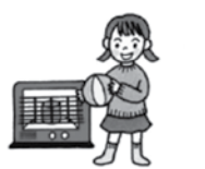
ストーブのそばであそばない