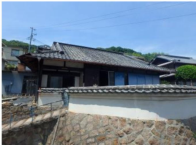
物件外見／和風のとても立派な石垣と塀が特長です。