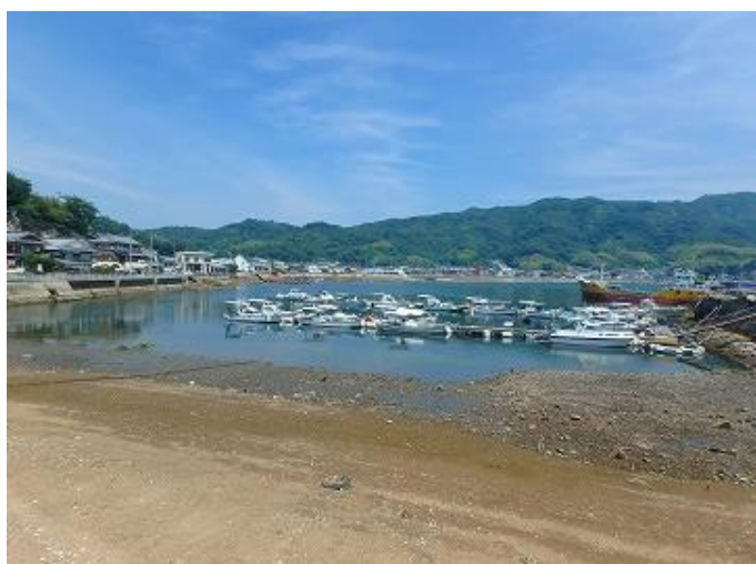
物件周辺／江田島と挟まれた釣土田港に面している藤脇地区は大変海が穏やかで、のどかなエリアです。