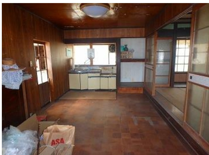
物件内部／ダイニングキッチンの様子 右隣が6畳和室、左にある勝手口は簡易倉庫に繋がっています。