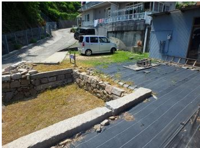
物件外見／敷地内の空き地の様子 手を加えれば普通車数台が駐車できます。