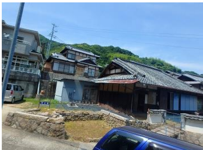
物件外観／大変日当たりがよくのどかな環境です。