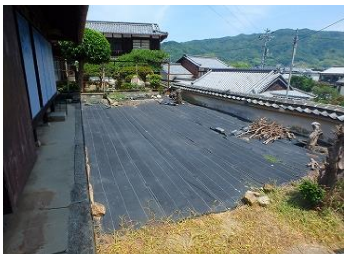
物件外観／正面には広いスペースがありますので、家庭菜園や庭づくりが楽しめそうです。奥の植栽の手前（フェンス）までが物件敷地です。