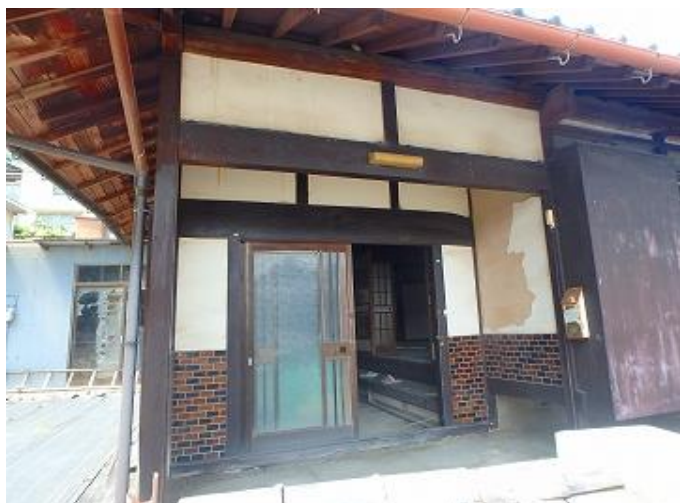
物件外観／玄関の様子 昔ながらの和風なお屋敷の玄関といった風情です。