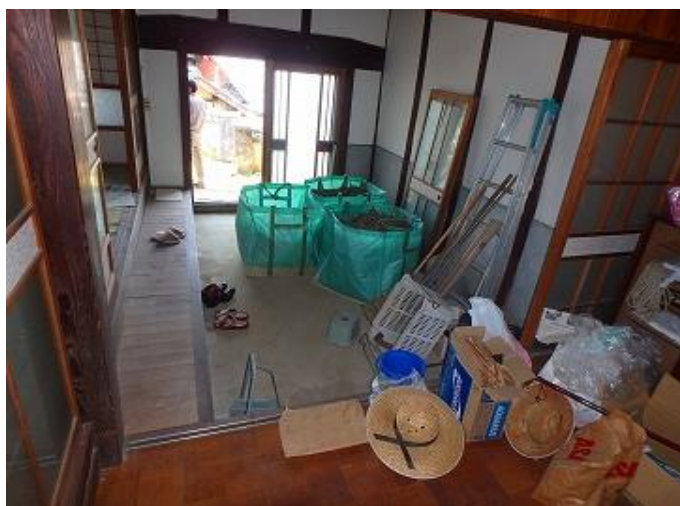
物件内部／ダイニングキッチン方向から見た土間～玄関の様子