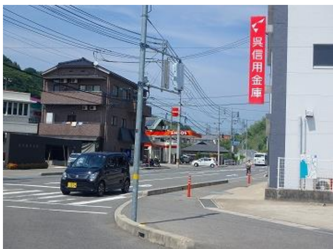
物件周辺／物件から直線距離約520メートルに藤脇バイパス・釣土田バイパス交差点があり、金融機関やガソリンスタンドがあります。 また、画像中央先の音戸町奥内地区にはホームセンター、釣土田バイパスを南に進んだ宇和木地区にはスーパーマーケットがあり、買い物しやすい環境が整っています。（ともに直線距離約2.3キロメートル）