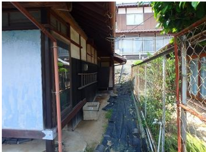
物件外観／物件東側の隣家との境界です。