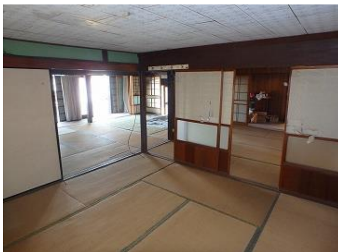
物件内部／6畳和室（東側）から玄関方向を見た様子 襖を取り外すと大広間に早変わりします。