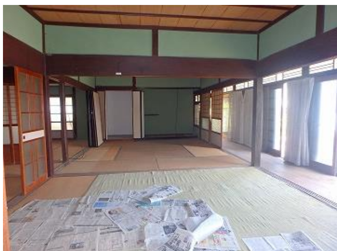
物件内部／土間から見た8畳和室二間の様子です。とても太い柱や梁が印象的です。左に縁側、右が6畳和室二間です。