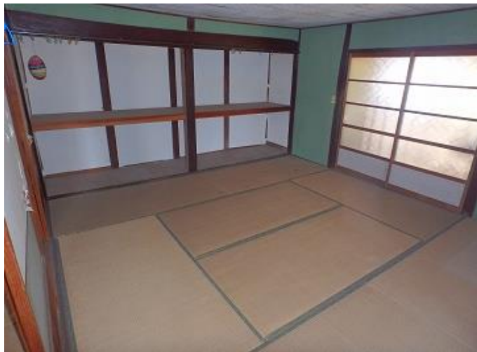
物件内部／6畳和室（東側）の様子 奥の扉に向こうにトイレがあります。