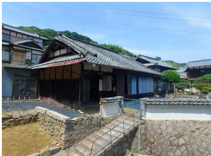
物件外観／建築時期が不明ですが、太い柱や梁、縁側、土間、石垣などが特徴的な純和風の平屋物件です。