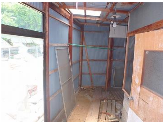
物件内部／勝手口から見た簡易倉庫内の様子 右の扉がお風呂の入り口です。