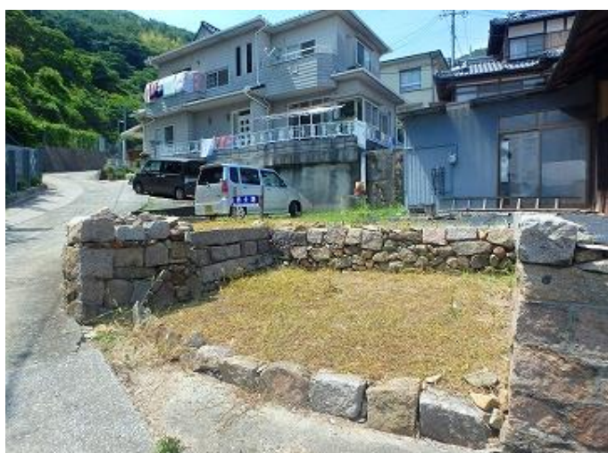
物件外観／釣土田バイパスから物件までの道路（画像左側）は普通車が通行できる幅員があります。（一部狭い箇所があります。日産テラノは難なく通過できました。）