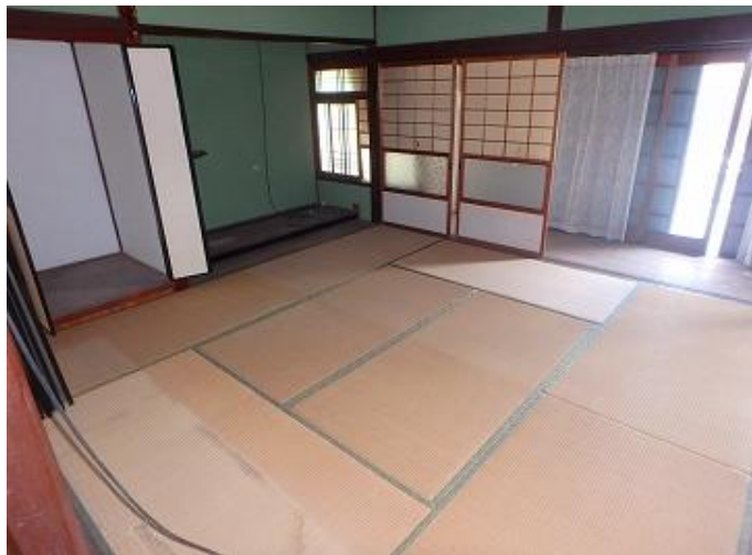
物件内部／8畳和室（東側）の様子 床の間と仏間があります。