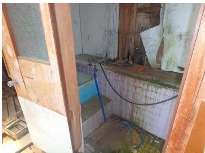
物件内部／簡易倉庫内のお風呂の様子 全く使えない状態と見受けられましたので、新たにお風呂を 設置する必要があると思われます。