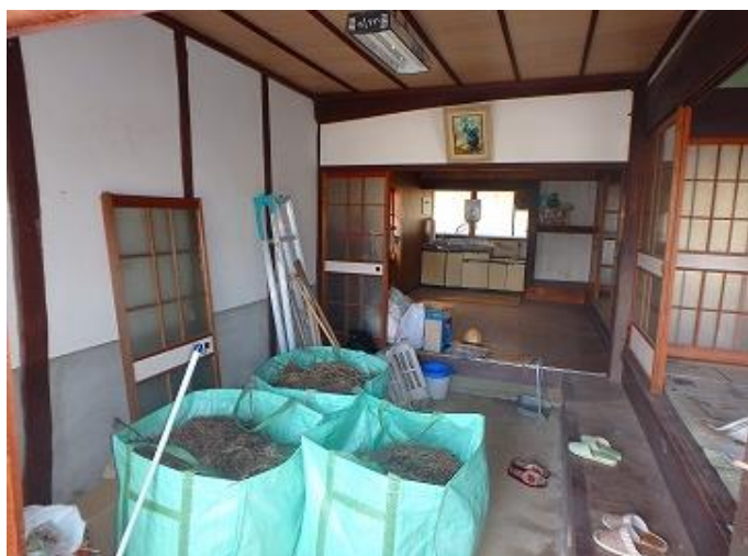
物件内部／土間の様子 大変広く、いろんな活用方法がありそうです。左手の和室4部屋、奥のダイニングキッチンへと繋がっています。