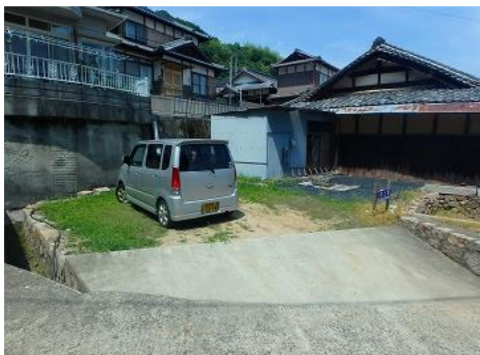
物件外観／軽自動車のちょうど向こう側に井戸があります。奥は以前の借り主が簡易的に設けられたお風呂と倉庫です。