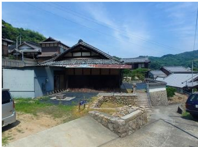
物件外観／手前には以前、倉があったとの事ですが現在は空き地になっています。石垣を取り壊せば大きな駐車スペースになりそうです。