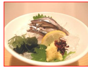
えんがんぶ こいわし(沿岸部)