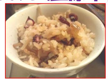
みはらし たこめし(三原市)