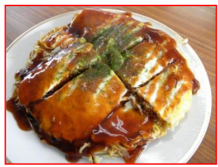
この や ぜんけん お好み焼き(全県)