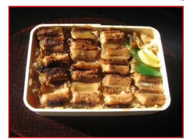
みやしまふ きん あなごめし(宮島付近)