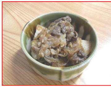
たく くれし 肉じゃが(呉市)