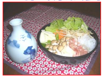
びしゅなべ ひがしひろしまし 美酒鍋(東広島市)