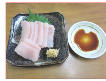
さしみ みよしし ワニの刺身(三次市)