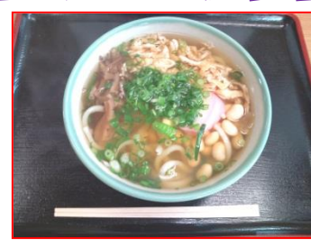
だいず えたじまし 大豆うどん(江田島市)