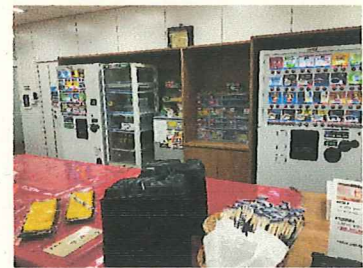
Lakeel Buffetのメニューと様子