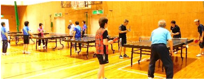
～昨年の様子(令和7年6月15日)～