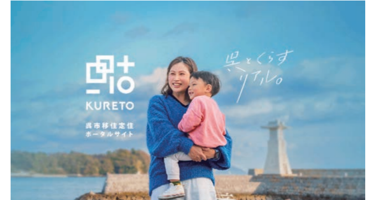
▲呉市移住定住ポータルサイト「KURETO」