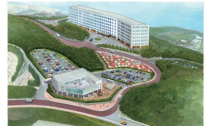
▲北側広場・北側広場駐車場エリアのイメージ

音戸の瀬戸公園一帯に、芝生広場や展望広場、飲食や特産品を提供する施設などを整備します。市民の皆さんが季節の花や景色を楽しみながら、気軽に立ち寄ってくつろげる空間をつくるとともに、室内で安心して遊べる子ども向けの遊び場を整備し、多くの人を訪れ、滞在を楽しめるエリアを目指します。