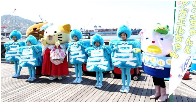
呉氏Jr.とみっけちゃんと一緒に写真撮影

今年もキャラ祭に参加し、たくさんの方に「暑いけど、頑張ってるねー!」、「可愛いねー」、「今年も会いましたね!」と声をかけてもらいました