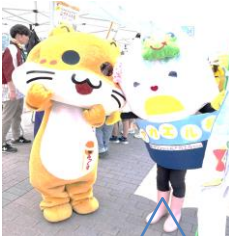
島根のみっくすちゃん とハイチーズ