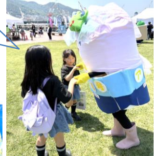
出店お疲れ様です