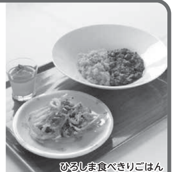
ひろしま食べきりごはん

主催：脱温暖化センターひろしま(広島県地球温暖化防止活動推進センター) ☎082-293-1512(平日8:30～17:30) 共催：脱温暖化ネットおんど