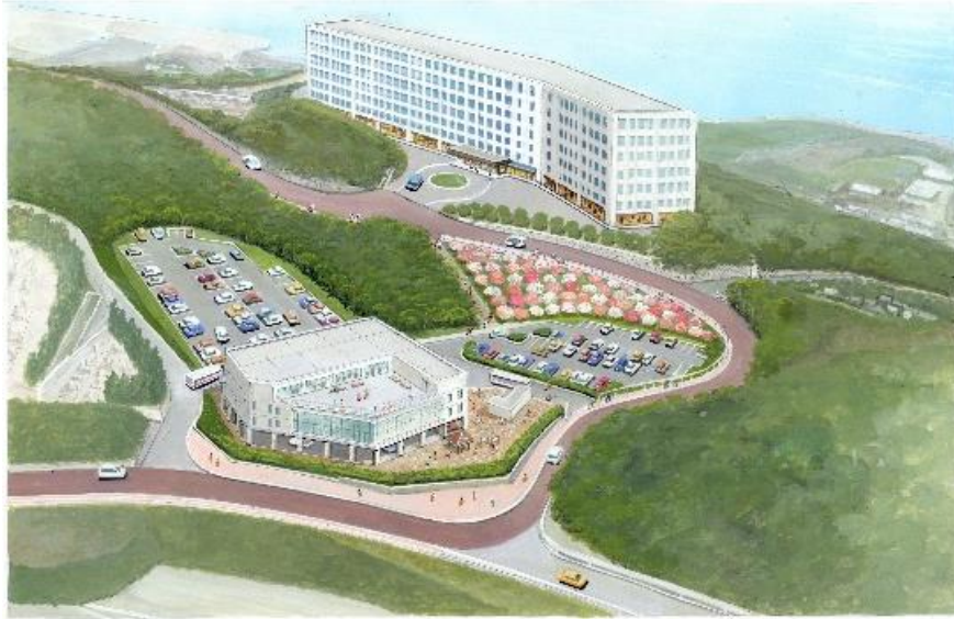
音戸の瀬戸公園の再整備 イメージパース