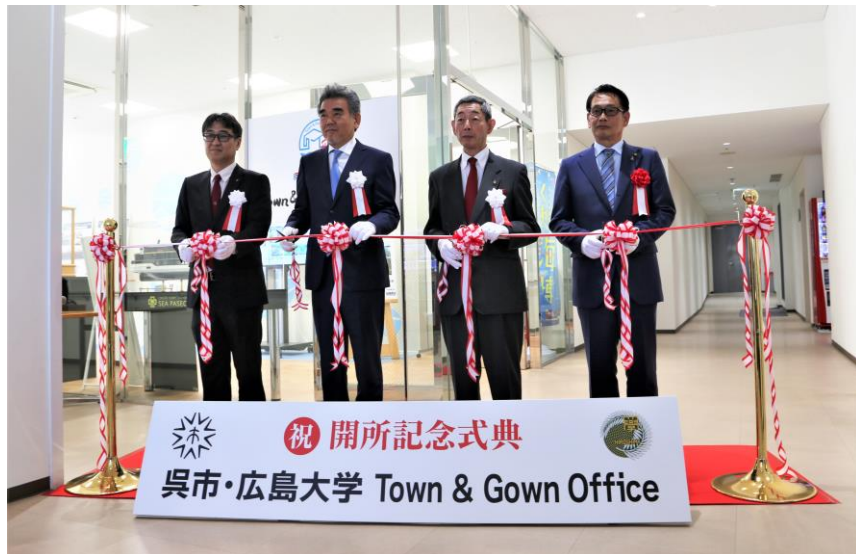
呉市・広島大学Town & Gown Office開所記念式典