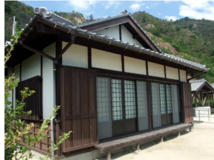
古民家風のきれいなコテージです。