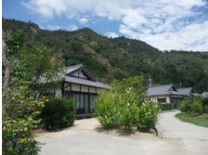
コテージが 4 棟立ち並びます。

・周辺には、観光施設などがあり、家族やグループで四季を通して自然を満喫できます。