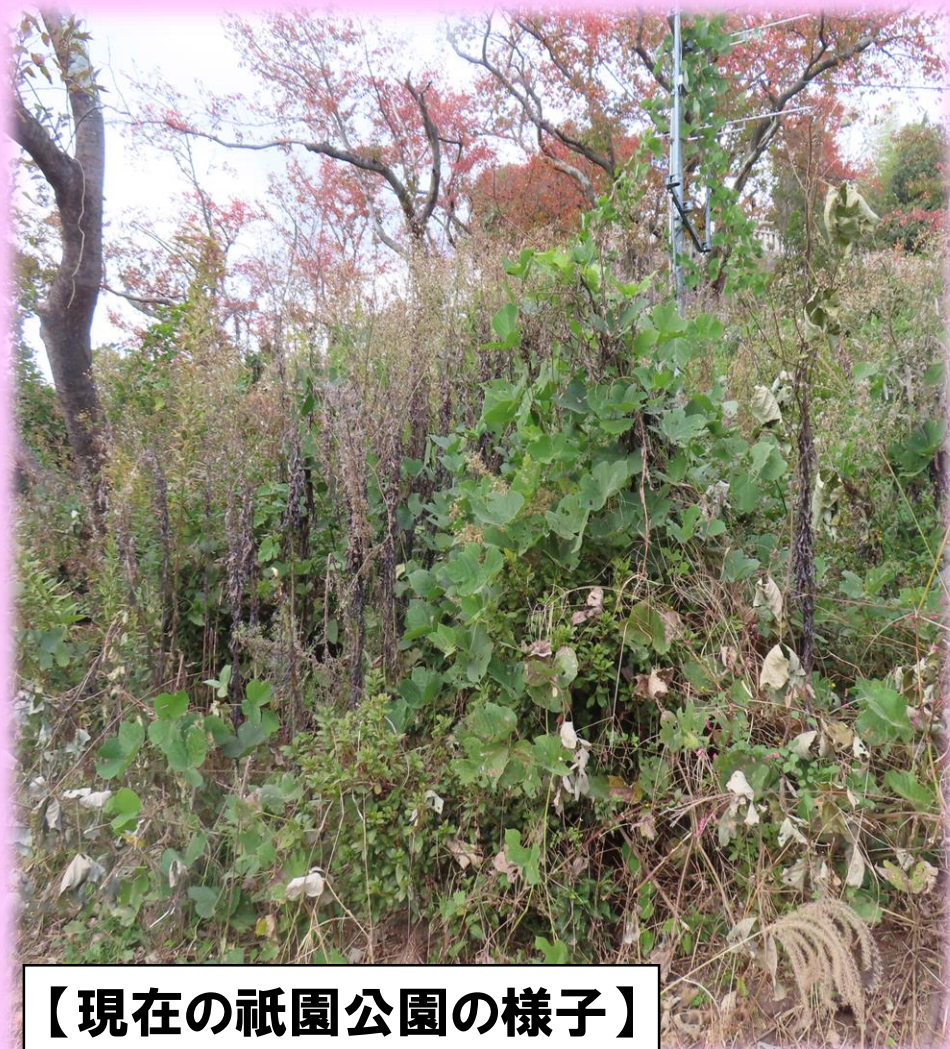
【現在の祇園公園の様子】