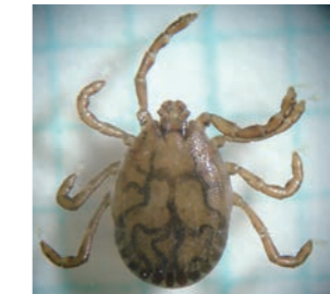
▲フタトゲチマダニ成虫

●広島FM (毎週月～木曜日 21:29ごろ) 呉市のCMを「大窪シゲキの9ジラジ」内で放送中! ●呉局 81.7MHz ●大崎局 76.4MHz