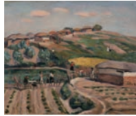
▲南薫造「遅日」 制作年不詳 南薫造記念館蔵