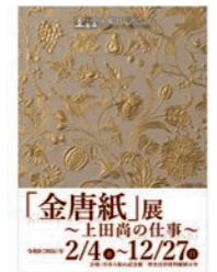
「金唐紙」展 ～上田尚の仕事～ 2/4～12/27