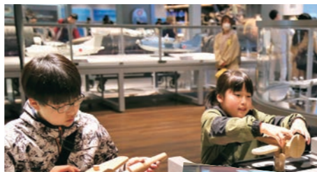
▲体験型の展示を楽しむ子どもたち