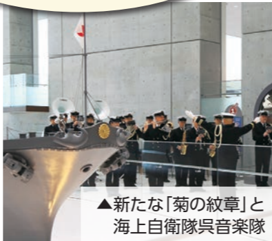
▲新たな「菊の紋章」と海上自衛隊呉音楽隊