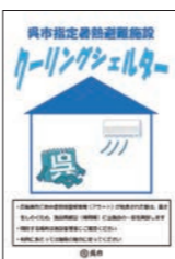
▲クーリングシェルターマーク

広島県において「熱中症特別警戒アラート※」が発表された場合、熱中症による市民等の健康被害を防止するため、市内の公共施設や民間施設において、クーリングシェルター(指定暑熱避難施設)を開放します。暑さをしのぐ場として、どなたでも利用できます。指定施設には、入口などに「クーリングシェルター・マーク」を掲示しています。利用できる日時などは施設によって異なります。詳しくは、市ホームページで確認してください。 ※「熱中症特別警戒アラート」は、過去に例のない危険な暑さが予想される場合に発表されるもので、熱中症警戒アラートとは異なります。熱中症警戒アラートの発表では、クーリングシェルターは開設しませんのでご注意ください。