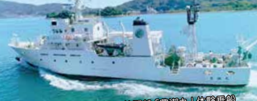
広島大学生物生産学部附属練習船「豊潮丸」体験乗船