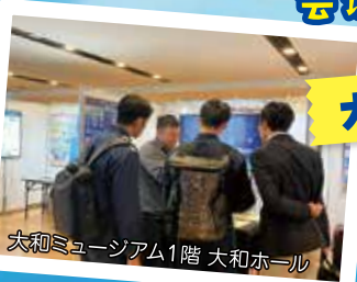
大和ミュージアム1階 大和ホール