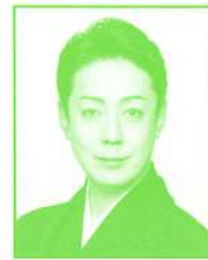
菊之助改め おのえきくごろう 八代目尾上菊五郎