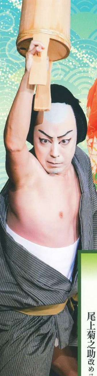
八代目 尾上菊五郎