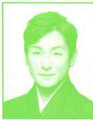
かたおかあいのすけ 片岡愛之助