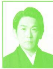
ばんどうひこさぶろう 坂東彦三郎