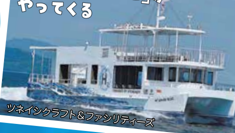
ツネインクラフト&ファンリテイーズ