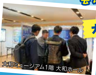
大和ミュージアム1階 大和ホール