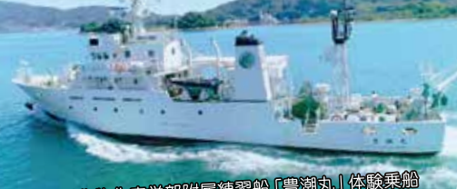
広島大学生物生産学部附属練習船「豊潮丸」体験乗船