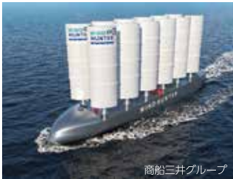
商船三井グループ