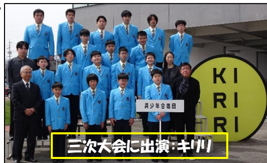
三次大会に出演:キリ