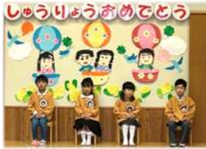
下蒲刈保育所 修了式