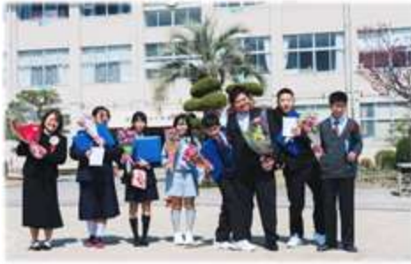
蒲刈小学校 卒業式