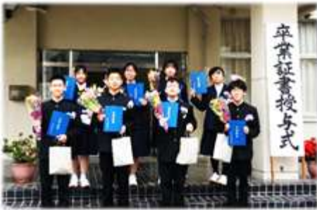
蒲刈中学校 卒業式