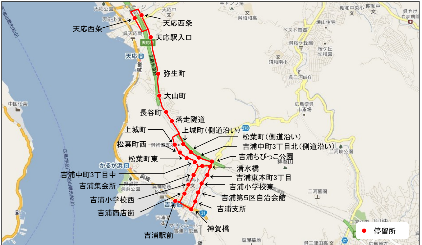
吉浦地区乗合タクシー路線図