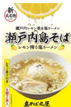
瀬戸内島そば 島の屋