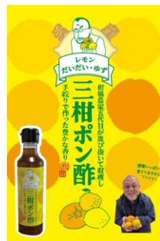
三柑ポン酢 瀬戸内プラスファイブ