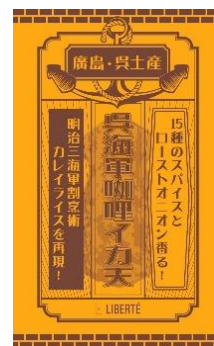
呉海軍咖喱イカ天 リベルテ本帆