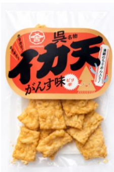
がんす味イカ天 ちりめん入り 石野水産