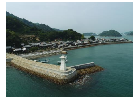
御手洗伝統的建造物群保存地区