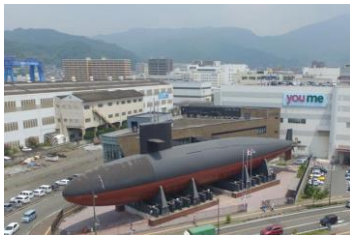
てつこのくじら館