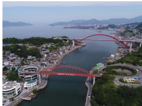
音戸大橋と第二音戸大橋