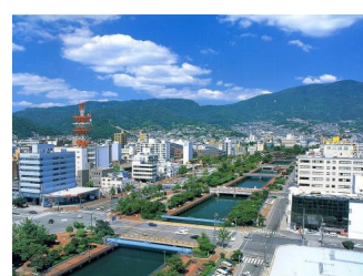
都市景観形成モデル事業