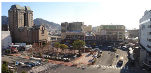
JR呉駅ビル・駅前広場