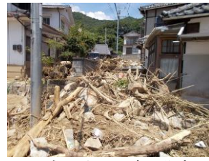
平成30年7月豪雨災害