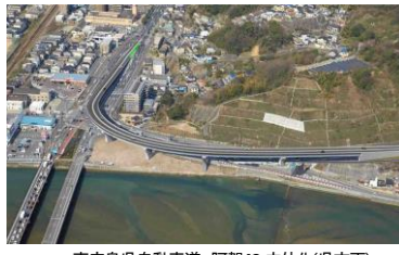
東広島呉自動車道 阿賀 IC 立体化(呉方面)