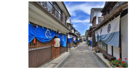
御手洗地区の町並み