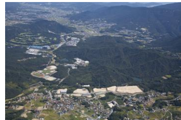
呉新世紀の丘開発