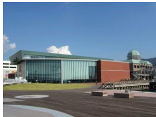
大和ミュージアム