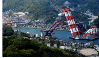
第二音戸大橋上部架設