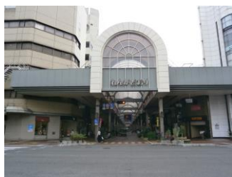
れんがどおりアーケード