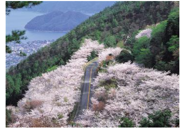
野呂山さざなみスカイライン