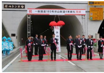
休山新道4車線開通