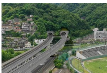
広島呉道路 呉IC付近 4車線化イメージ