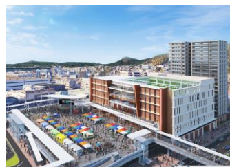
呉駅周辺地域総合開発(完成イメージ)