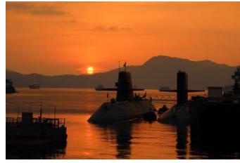
潜水艦基地の夕暮れ