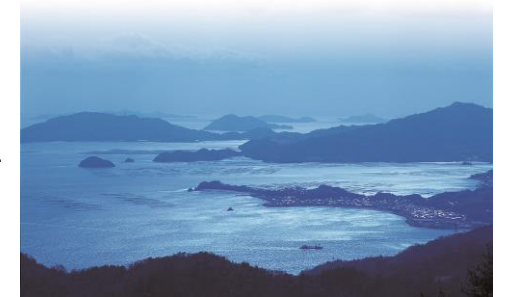
野呂山からの眺望