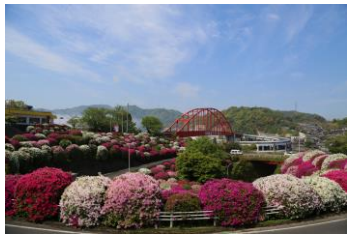
音戸の瀬戸のヒラドツツジ