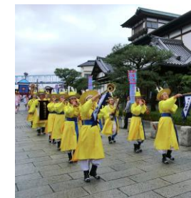
朝鮮通信使再現行列