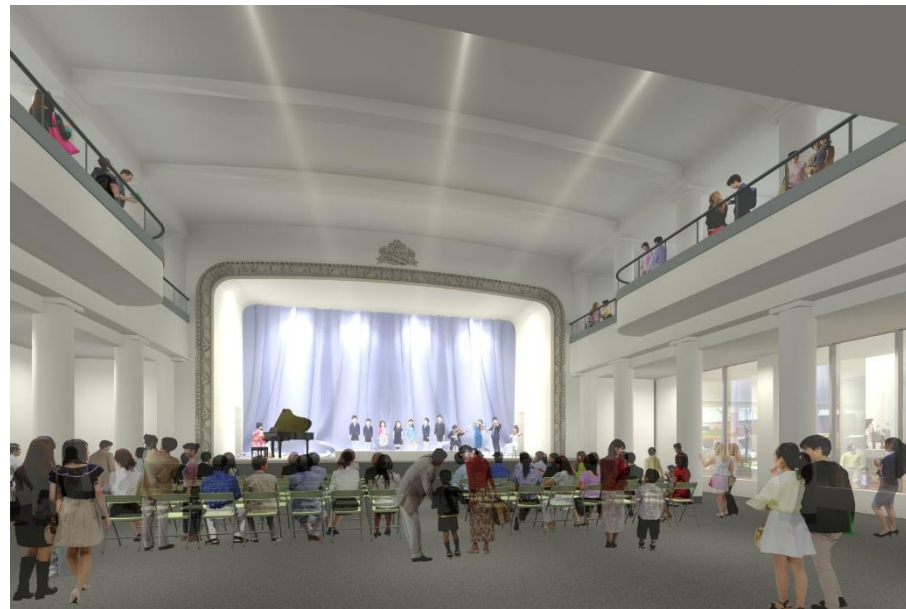
ホール整備イメージ