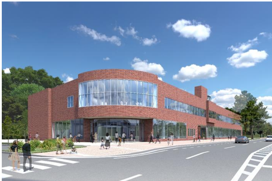
新たな複合施設整備イメージ