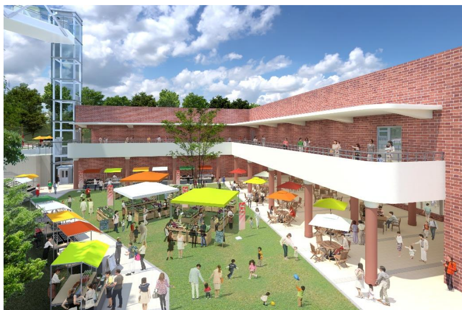
中庭整備イメージ