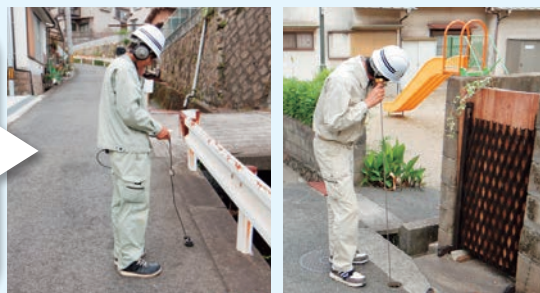
漏水探知機(左)、音聴棒(右)を使用した漏水調査

地中にある水道管の漏水箇所を特定するため、音調棒や漏水探知機を使用した漏水調査を行っています。調査は市内を6ブロックに分けて、1年に1ブロックずつ、市内すべての水道管の漏水調査を専門業者が行っています。(調査は、静かで漏水音が聞こえやすい夜間に行います)