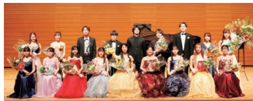
▲2024年新人コンサート写真

※入場整理券が必要。同ホール、新日本造機ホール、各まちづくりセンター、市内楽器店で配布。