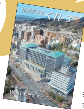
※表紙 市役所新庁舎