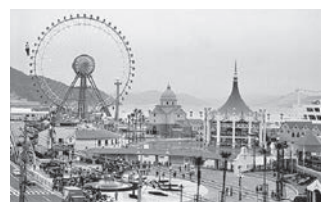
▲当時の呉ポートピアランド