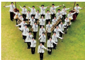
▲呉高等学校吹奏楽部