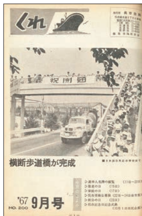
※表紙 横断歩道橋の完成 (天応地区)