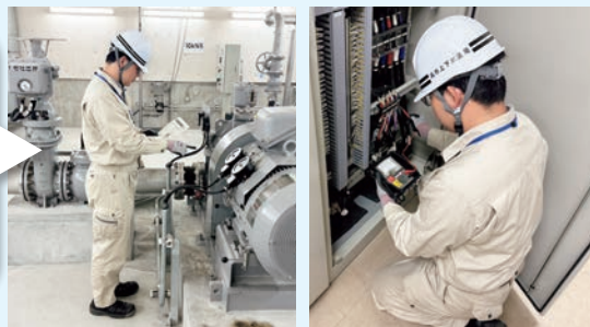
ポンプ所での点検作業(平原高区ポンプ所)

配水池やポンプ所の点検時には、設備運転時の温度などを確認しています。この作業は設備の異常を早期に発見し、突発的な故障や事故を防止するための重要な作業です。また、設備運転時のわずかな音や振動、汚れなども確認しながら保守点検を行っています。