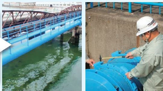
ハンマーによる水道橋の打音検査

事故が発生した場合に市民生活への影響が大きい重要な水道管路は、定期的にパトロールや点検作業を行っています。水管橋もその一つであり、職員による目視での塗装状況の確認や、ハンマーによる打音検査を行っています。異常や漏水を発見したときは速やかに修繕作業を行います。