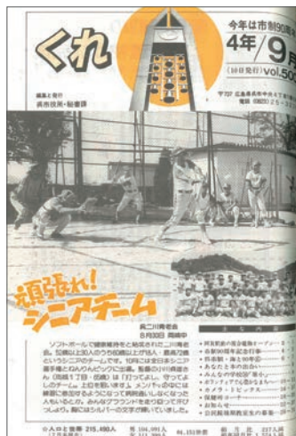
※表紙 野球のシニアチーム

600号では、「21世紀が始まったよスペシャル! いろんな夢を聞きました」と題して特集。身近な家族の幸せから、呉の明るい未来まで、さまざまな夢を語ってもらいました。