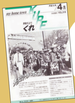
※表紙 初開催の さくら祭(菅戸地区)