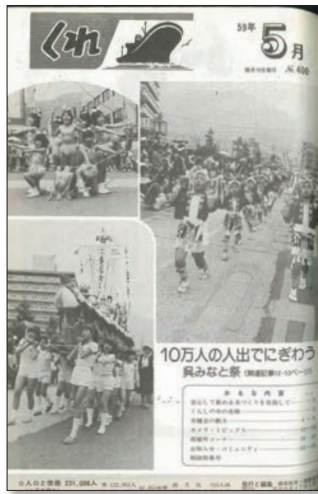
※表紙 第27回呉みなと祭り