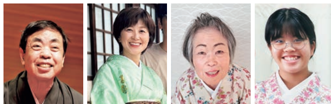
▲ジャンボ衣笠 ▲あなうんす亭小馬 ▲ジャンボ亭おかん ▲広南亭あべこべ