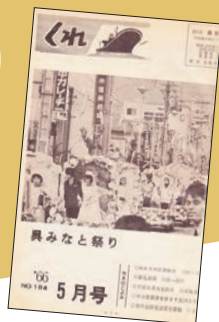
※表紙 第9回呉みなと祭