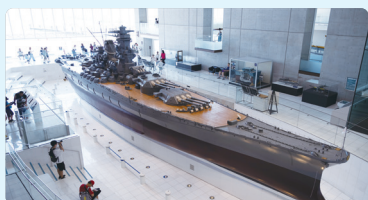
大和ミュージアムリニューアル 施設と展示の大規模リニューアル（2026 年 4 月リ ニューアルオープン）