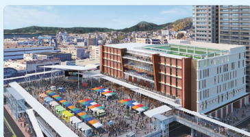
呉駅前再開発 駅周辺地域を総合交通拠点とし、交通まちづくりと スマートシティの発信拠点を形成