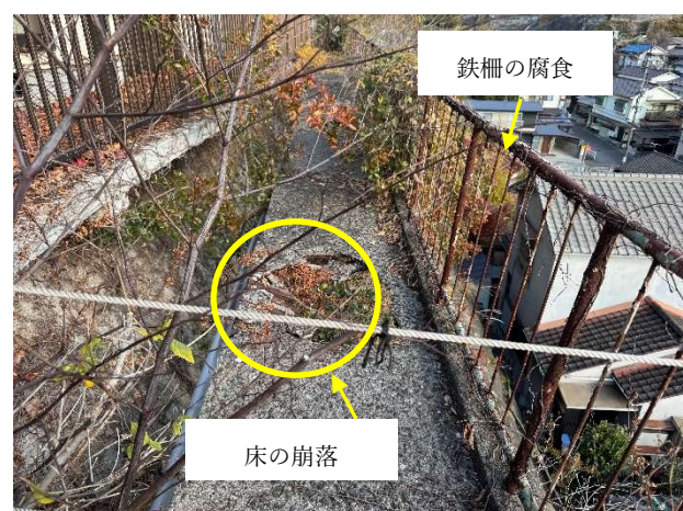
進入通路(鉄骨橋梁)