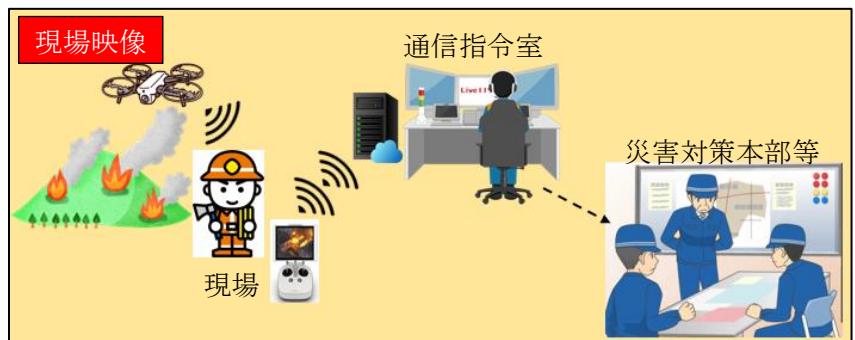
【映像共有のイメージ】