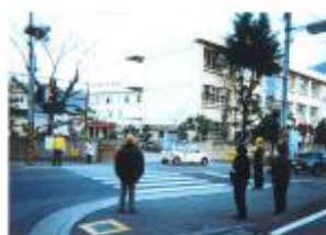
1のつく日の 声かけ運動