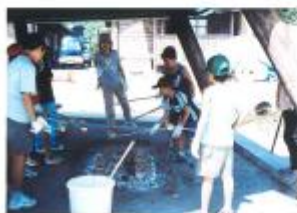
藻塩と 土器づくりを 体験している 子どもたち