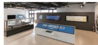
Exhibit of drawings of naval vessels