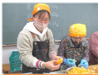
2/27 ジャム作り講座に参加

来年度は、みんなの暮らしの知恵を集めるラジオ番組を制作します。1年半の暮らしで見えてきた、自然を活用する術や、四季を取り入れた暮らしを、島から島内外へ発信していきたいと思うようになりました! ラジオの他にも、とびしま海道の観光情報サイト、マップなどの作成をしているのですが、ディープな内容を集めて発信していきたいと思っています! 島のこと、みなさんのこと、たくさん教えてください! アイデアもお待ちしております!