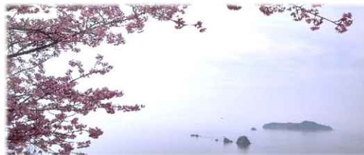
↑であいの館の奥からみた海