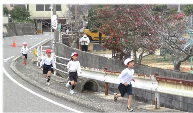
蒲刈小学校 持久走大会 (R7.2.7)

200人(蒲刈小舎)を超える来場者が、舞の迫力と太鼓や笛の音色に圧倒されました。