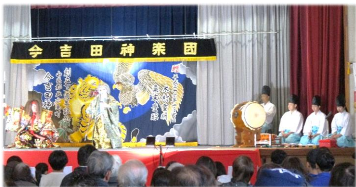
今吉田神楽団公演 (R7.2.1 蒲刈小学校主催)

200人(蒲刈小舎)を超える来場者が、舞の迫力と太鼓や笛の音色に圧倒されました。