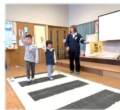
下蒲刈保育所交通安全指導(R7.2.18)